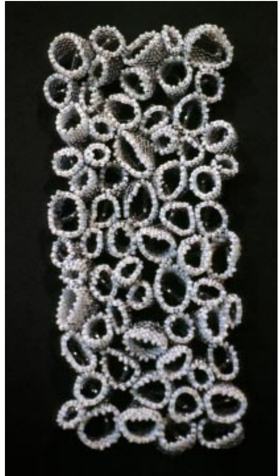
Tubular Formation (Collection Ville de Montréal) 1999 Tissage perlé à la main Perles de verre, fils de nylon 18cm x 9cm x 6cm

Repères pour collectionneurs On retrouve actuellement des œuvres de Natasha St. Michael dans la collection « Prêt d'œuvres d'art » du Musée national des beaux-arts du Québec ainsi que dans la collection de la Ville de Montréal. Depuis 2002, les galeries Flatfile de Chicago et Luniverre de Paris offrent une place privilégiée aux travaux de l'artiste. Par sa présence remarquée aux salons SOFA de New York et Chicago de même qu'aux biennales de Chieri et de Pittsburgh consacrées à l'art textile, Natasha St. Michael fait partie des emblèmes de la créativité textile, domaine où les révolutions technologiques ouvrent mille et un horizons. Enfin, Fiberarts Design Book 7, répertoire international des arts textiles, consacre plusieurs pages aux tissages de perles signés St. Michael.